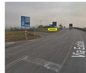
01.D - Dettaglio area