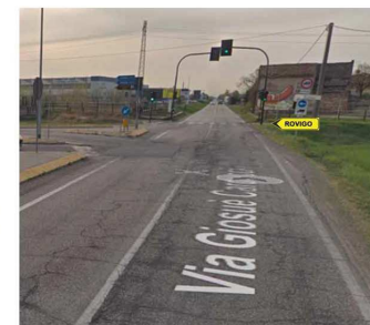
01.C - Dettaglio area