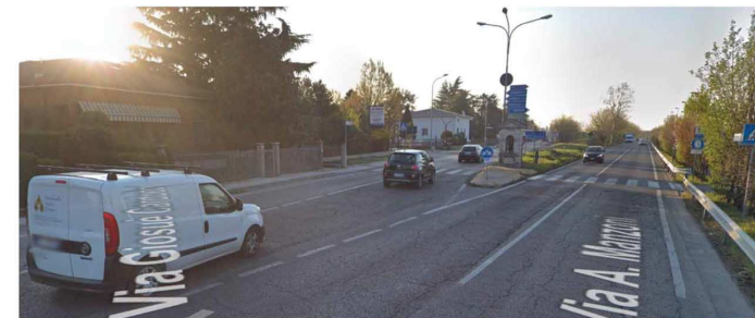
01.B Dettaglio svincolo con SP2

(vedi TAV 03 per dettaglio segnaletica stradale per la chiusura temporanea di una carreggiata con uscita obbligatoria su un ramo di svincolo)